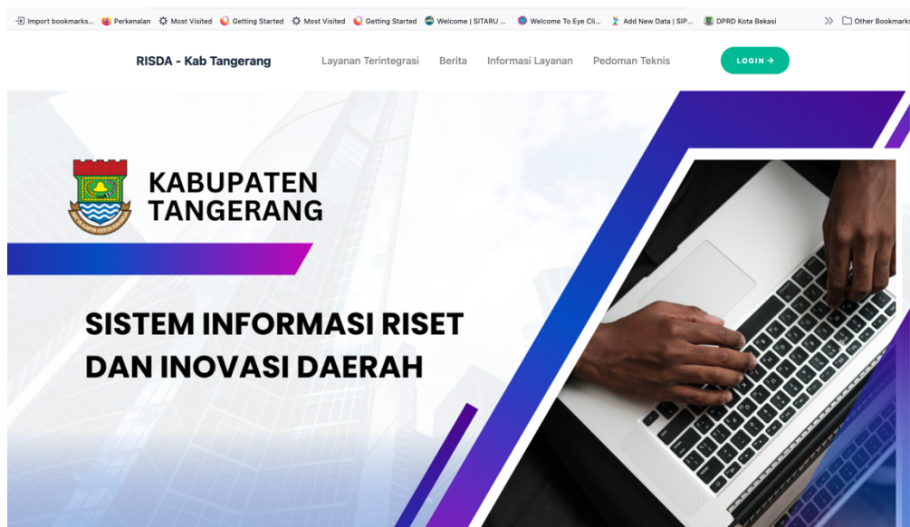
Gambar 2. Layanan Inovasi Daerah berbasis TIK