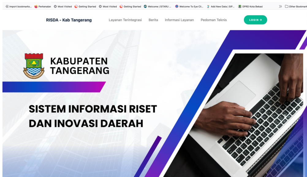
Gambar 2. Layanan Inovasi Daerah berbasis TIK