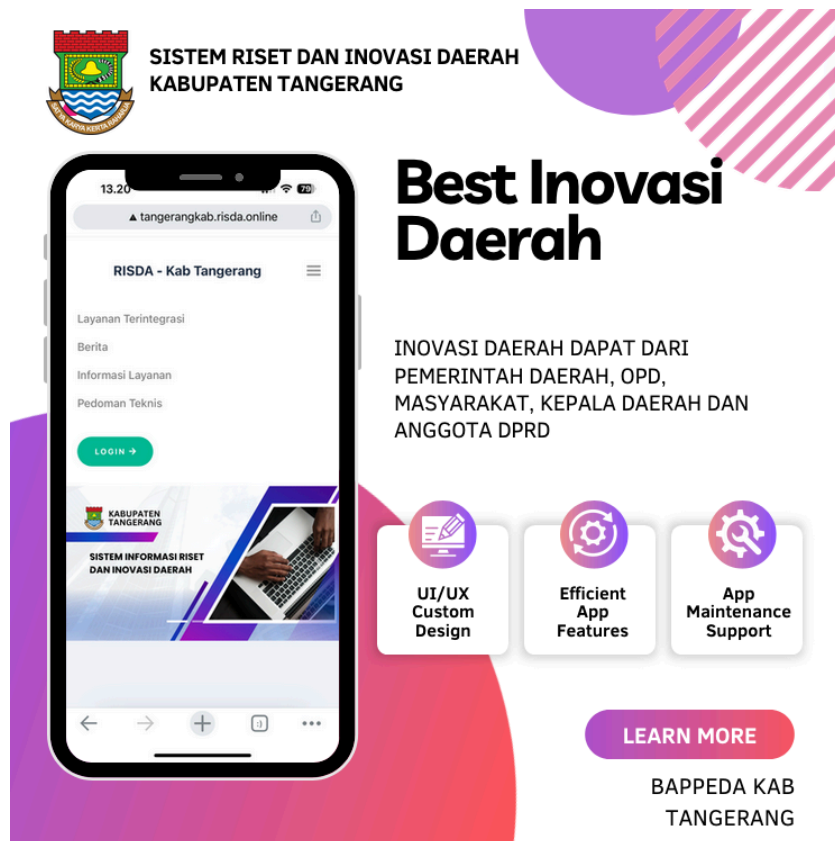
Gambar 1.1 Informasi Layanan di Inovasi Daerah di Kabupaten Tangerang