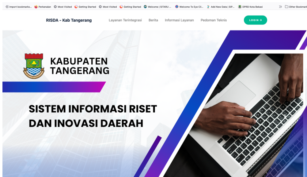
Gambar 2. Layanan Inovasi Daerah berbasis TI