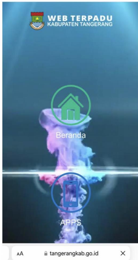
Gambar 1. Instalasi Inovasi Daerah Gambar

melalui aplikasi smartphone. Dengan peta digital, setiap penggunanya dapat memakai peta yang lebih interaktif dari sekadar gulungan kertas. Kelebihan yang lain adalah pada peta digital mudah disimpan dan dipindahkan dari satu media penyimpanan ke media penyimpanan yang lain. Untuk hal itu inisiator inovasi menerapkan kemudahan layanan informasi dengan didukung aplikasi android. berikut layanan informasi dapat diakses dengan menginstal hal berikut: